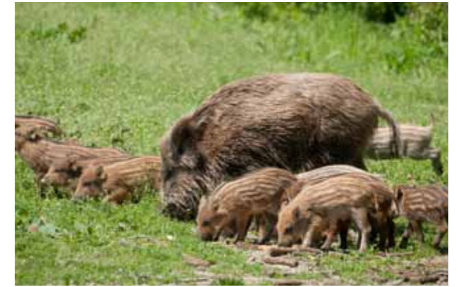
Abbildung 4: Gesunde europäische Wildschweine (Frischlinge)

Erste Versuche zur Erforschung des genotypischen Einflusses auf den Krankheitsverlauf an unterschiedlichen Schweinerassen (Deutsche Landrasse, Hybridschweine und Europäische Wildschweine (Abb. 4)) zeigten, dass alle Rassen gleichermaßen empfänglich für das Virus der Klassischen Schweinepest waren. Wildschweine zeigten zwar generell weniger Symptome, dies hatte jedoch keinen Einfluss auf den Ausgang der Erkrankung. Unterschiede des Infektionsverlaufs ergaben sich bei allen Schweinerassen generell auf individueller Basis. Auch in Bezug auf immunologische Reaktionen nach Impfungen gegen die Klassische Schweinepest mit unterschiedlichen Impfstoffen wurden wenig rassespezifische Unterschiede beobachtet. Alle Tiere bildeten eine Immunantwort aus. Um den individuellen Ausprägungen weiter auf den Grund zu gehen, wurden Testverfahren entwickelt und überprüft, die es gestatten, immunologische Botenstoffe und zelluläre Reaktionsmuster im Detail zu untersuchen. Dies könnte zur Klärung der Frage beitragen, ob man die auf individueller Basis auftretenden positiven Reaktionsmuster unterstützen kann, sei es durch züchterische oder technische Maßnahmen.