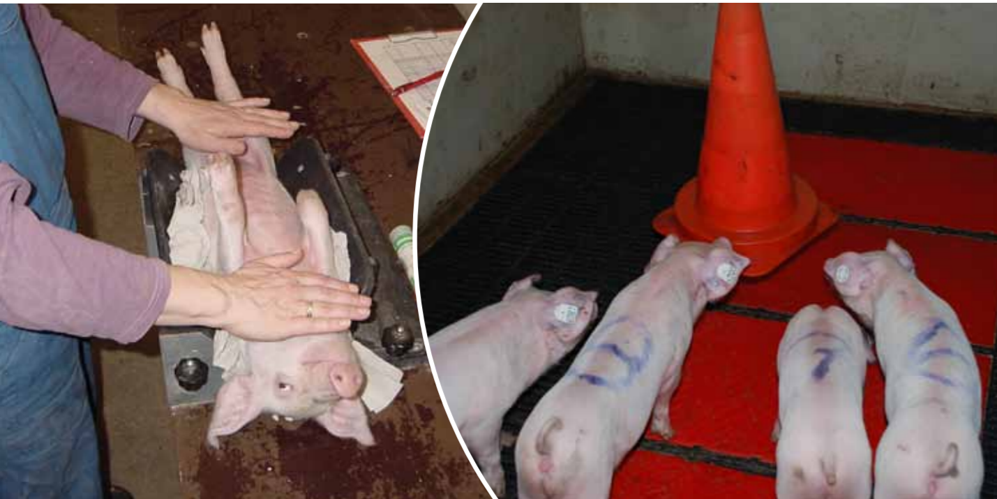
Abbildung 2: Beispiele für an den Schweinen durchgeführte Verhaltenstests zur Bestimmung der Verhaltensphänotypen: beim Backtest werden die Schweine eine Minute auf dem Rücken fixiert und die Abwehrreaktion gemessen (links); im Novel-Object-Test wird den Tieren ein ihnen unbekanntes Objekt präsentiert (hier der Verkehrskegel) und ihr Verhalten aufgezeichnet (rechts)

der vorab beschriebenen Coping-Strategien vor und nach einer Impfung Blut abgenommen, um Parameter ihrer Immunantwort und die Genexpression in den Leukozyten zu bestimmen. Diese Daten machen es möglich, einzelne Gene oder komplexe Signalwege zu identifizieren, die im Rahmen der Immunantwort und im Zusammenhang mit anderen züchterisch wichtigen Funktionen an entscheidenden Schlüsselpositionen stehen.